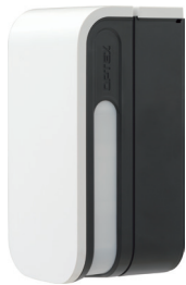
Détection de l'alerte