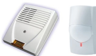
Autres capteurs et/ou alerte sonore et/ou lumineuse (optionnel)